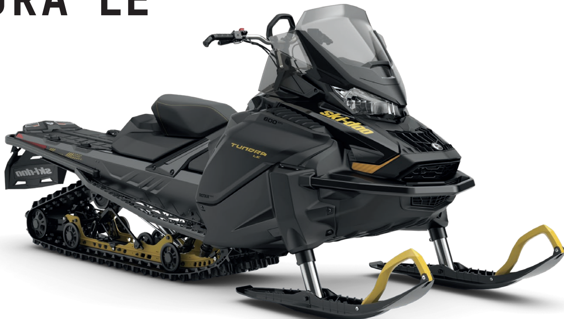
TUNDRA LE 600 EFI VISAS