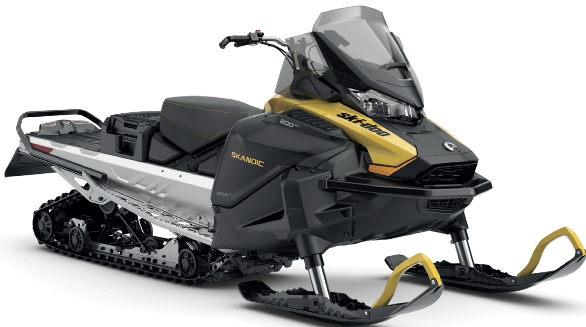
SKANDIC SPORT 600 EFI VISAS